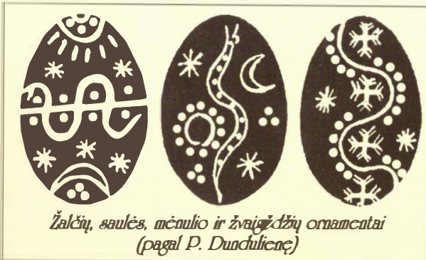
Žalčių, saulės, mėnulio ir žvaigždžių ornamentai (pagal P. Dunchilicę)

Norėdami dažytam kiaušiniui suteikti galin-gesnės maginės reikšmės, žmonės jį margin-davo įvairiais geometriniais ir augaliniais orna-mentais. Pasitaiko zoomorfinių motyvų. Turintys meninių polinkų iš žiedelių, žvaigždžių, krypučių, lapelių, rombų sukurdavo sudėtingas menines kompozicijas, ku-rias galima skaityti tarytum raštą. Vienspalvius kiaušinius skutinėda-vo stiklo molauža, adata, molaužta peilio geležte. Profesionalūs sku-tinėtojai įrankį pasidaro iš dildės.